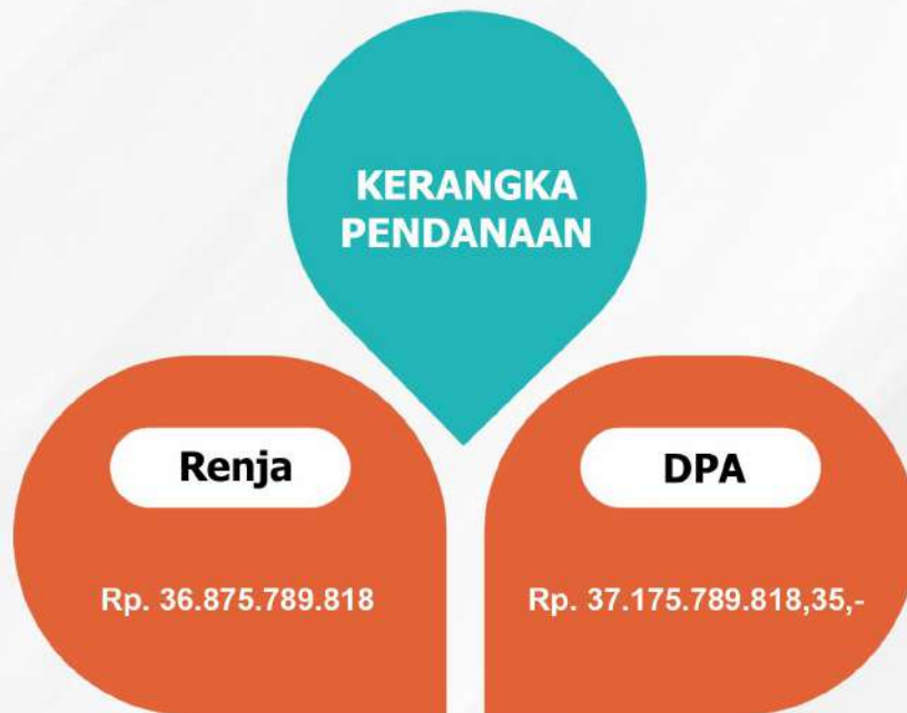
Gambar 2.7 Pendanaan antara Perubahan Renja dan Perubahan DPA tahun 2022