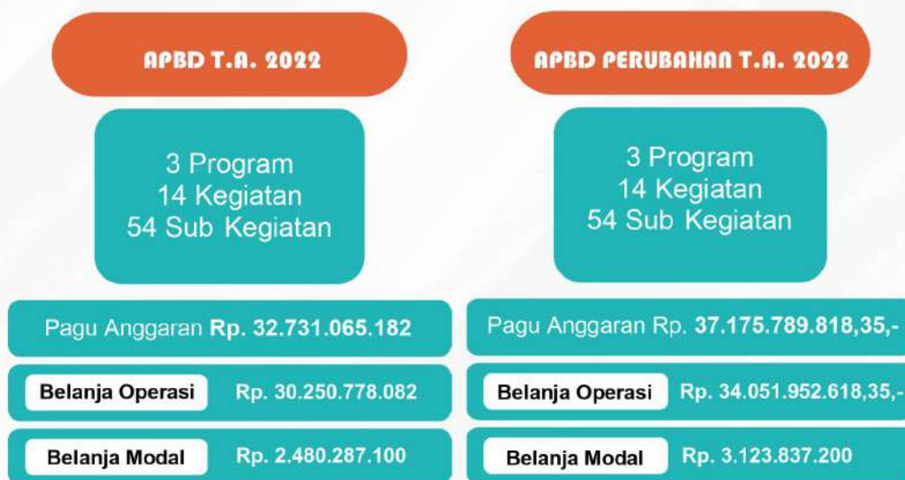
Gambar 2.3 : Alokasi Anggaran BAPPEDA Tahun 2022

Adapun struktur belanja APBD Bappeda Provinsi Lampung Tahun Anggaran 2022 lebih jelasnya dapat dilihat pada gambar berikut: