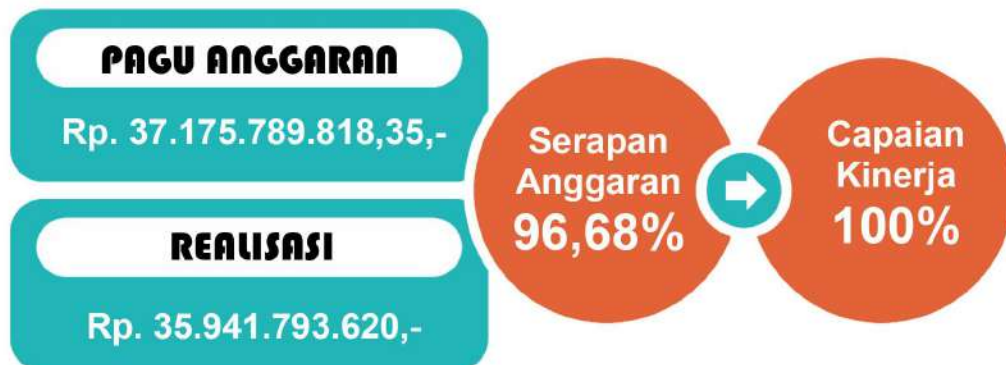
Gambar 3.1 Realisasi Kinerja dan Anggaran Tahun 2022

Berdasarkan APBD Perubahan Tahun 2022, anggaran belanja terbagi dalam Sasaran Utama sebesar Rp. 7.410.873.100,- dan Sasaran Pendukung Rp. 29.764.916.718,35,-. Anggaran belanja yang mendukung tercapainya sasaran pendukung tersebut lebih besar dari pada anggaran belanja yang mendukung tercapainya sasaran utama. Hal ini disebabkan adanya perubahan nomenklatur belanja, dimana sejak Tahun 2021, terdapat 1 sub kegiatan yang didalam nya mengakomodir belanja gaji ASN yang sebesar Rp. 15.403.632.900,-