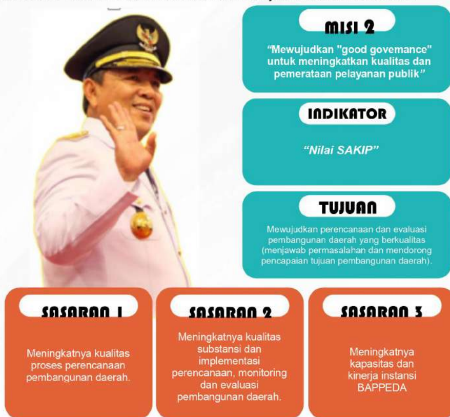
Gambar 2.1 : Indikator Kinerja Bappeda 2019-2024

Mengacu pada Visi “Rakyat Lampung Berjaya” dan 6 (enam) Misi RPJMD Provinsi Lampung Tahun 2019-2024, BAPPEDA sebagai unsur Penunjang Pemerintahan urusan Perencanaan mendukung pencapaian Misi ke- 2 yaitu “Mewujudkan good governance untuk meningkatkan kualitas dan pemerataan pelayanan publik” dengan Sasaran RPJMD yaitu “Meningkatnya Kualitas Reformasi Birokrasi dan Akuntabilitas Kinerja Pemerintah Daerah”.