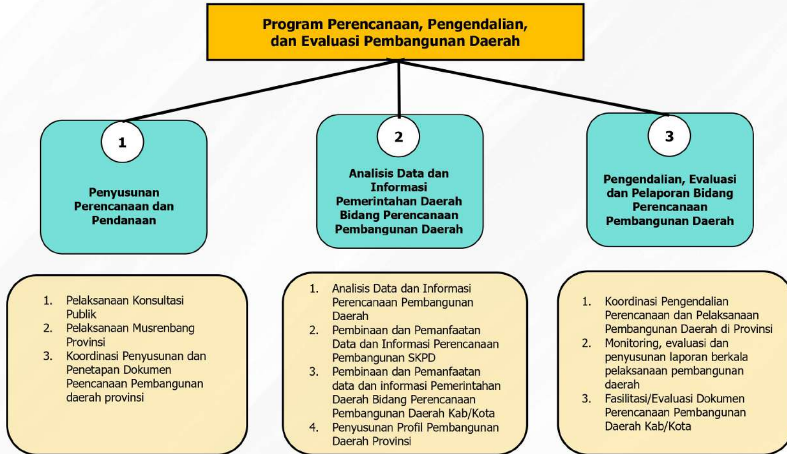
Gambar 2.5 Program, Kegiatan dan Sub Kegiatan pada Sasaran Utama 1